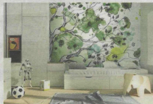
► Otoczenie ma znaczący wpływ na rozwój dziecka. Różnorodne kolory i wzory działają na wyobraźnię malucha