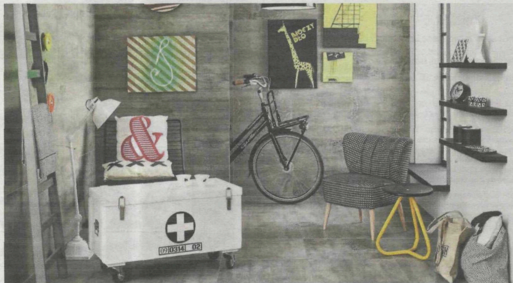
► Surowy, loftowy styl bazujący na stonowanych szarościach, podkreślonych wyrazistymi dodatkami spodoba się nastolatkom

nowoczesnej technologii drukowania na najlepszej jakości materiałach.