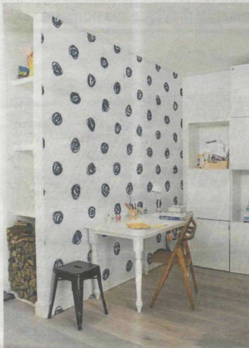
► Przy pomocy fototapety można szybko i względnie tanio zmienić wystrój pokoju dziecka

Na szczęście przyklejenie fototapety zajmuje tylko chwilę i każdy może zrobić to sam. Dzięki temu możliwa jest zupełna metamorfoza pokoju dziecka tak często, jak tylko przyjdzie nam na to ochota. Poniżej niezaprzeczalną zaletą fototapet jest także wysoka trwałość, uzyskiwana dzięki